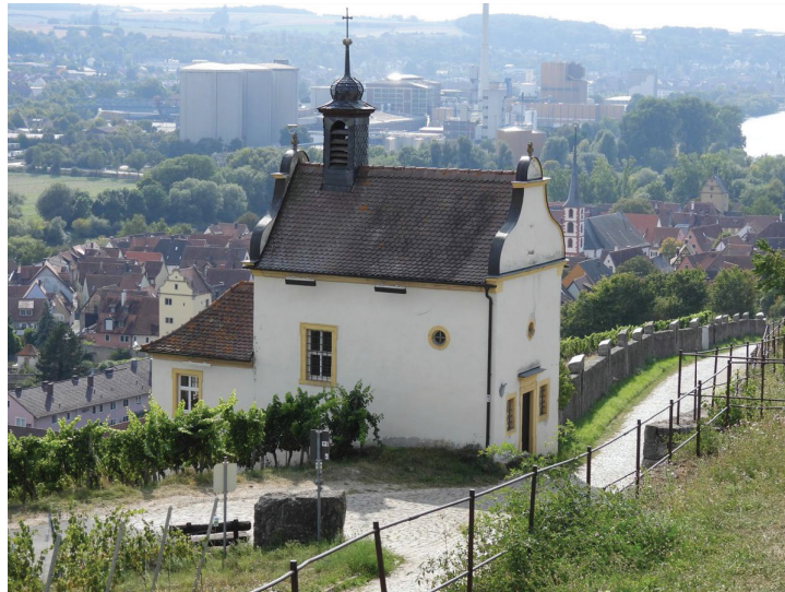
Abb. 3: Gastgeschenk der Gemeinde, auf Acrylglas mit Aufhängerahmen