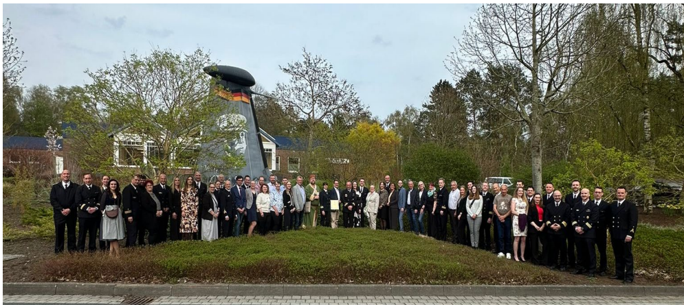
Abb. 2: Gruppenbild mit allen Teilnehmerinnen und Teilnehmer der Patenschafts-Veranstaltung 2026

Mit dieser glanzvollen Darbietung, geprägt durch lyrischen Wortlaut und großartige visuelle Effekte, konnte fast live mitverfolgt werden, wie ein bestimmtes Anflugmanöver auf „Hoher See“ mit dem Staffelhubschrauber SeaLynx abläuft. Dies verursachte bei dem einen oder anderen gebannten Zuhörer eine Gänsehaut. Ebenso wurde die Verbundenheit mit dem scheidenden Bordhubschrauber und der Staffel verdeutlicht und gefestigt.