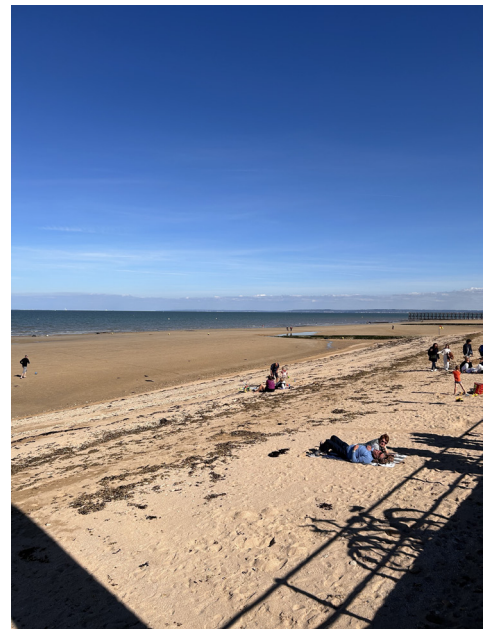
Blick auf den Strand in Luc sur Mer.

Gegen Mittag Rückankunft in Frickenhausen