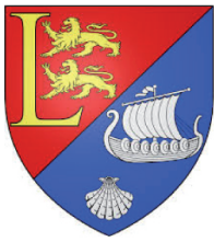
Luc sur Mer