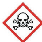
Giftig Sehr giftig