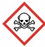
Giftig Sehr giftig