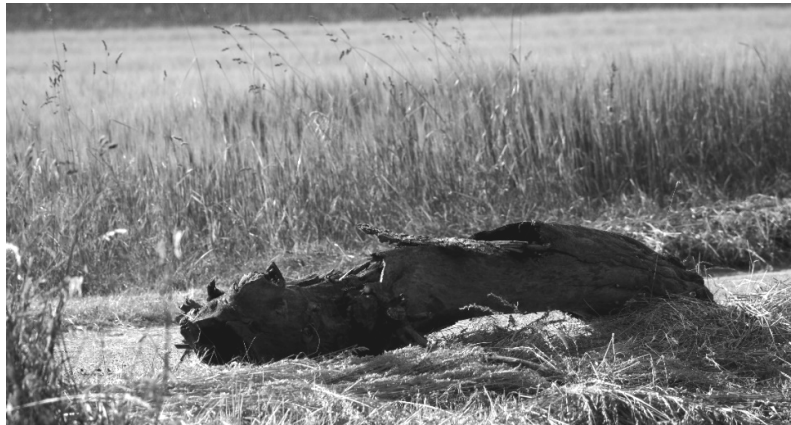
Kriechendes Totholzmonster oder umgefallene Hexe?

Beeindruckend ---Phantasie anregend --- rätselhaft